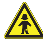
GUZY I SINIAKI